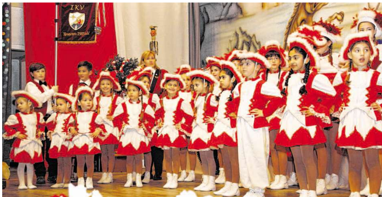
Auch als Gast der ÜPKG begeisterte der Nachwuchs des IKV sein Publikum.